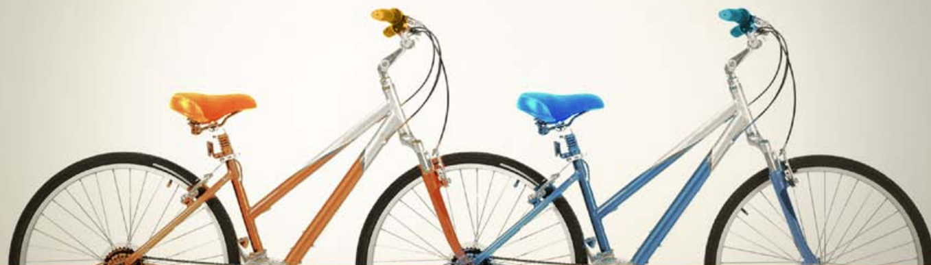
TAVOLA ROTONDA ITALO-OLANDESE PER PROMUOVERE LA CICLABILITÀ SCAMBIO DI ESPERIENZE TRA ESPERTI E AMMINISTRAZIONI

PADOVA • SABATO, 20 SETTEMBRE 2014, ORE 14.30 • PADOVAFIERE, EXPOBICI - SALA 7 B, PADIGLIONE 7